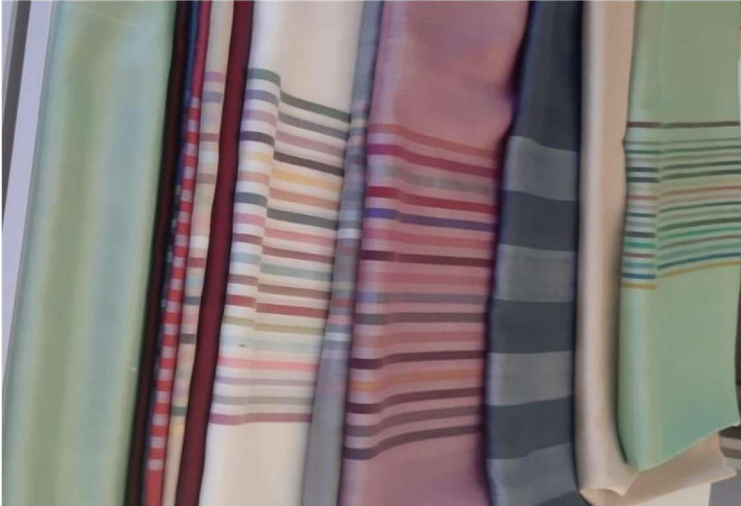
fotoğraf 5. Kulp Kaymakamlığı Kadın İstihdam ve Yaşam Merkezi 28.10.2022