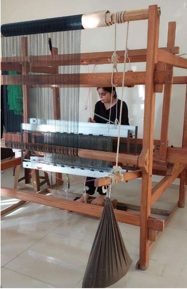
fotoğraf 6. Kulp Kaymakamlığı Kadın İstihdam ve Yaşam Merkezi 28.10.2022

Kalkınma Bakanlığı tarafından desteklenen İpek İpliği Üretim Tesisi Projesinde 37 kişi istihdam edilmiştir. 80 ton kuru koza işleyecek kapasitede uygulamaya konulan projede ayrıca çalışanlara eğitim vermek üzere Çin'den 3 eğitmen getirilmiştir. İpek İplik Üretim Tesisi 2013 yılı itibari ile üretime başlamıştır. 16.03.2014 tarihinde Diyarbakı'ın Kulp ilçesine bağlı Ağaçalı köyünde açılışı yapılmıştır.