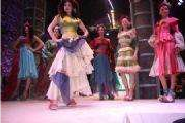
fotoğraf 4.