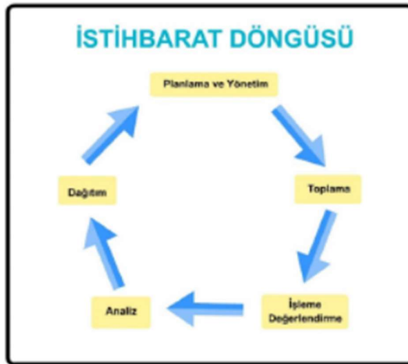
Şekil 2: İstihbarat Döngüsü

İstihbarat toplama faaliyeti “istihbarat döngüsü” (intelligence cycle) planlama ve yönetim, toplama, değerlendirme, analiz ile dağıtım aşamalarını içeren bir döngüsel süreçtir. Bu süreç, bilgilerin toplanması ve işlenerek kullanılabilir hale getirilmesi için bir çerçeve sağlamaktadır. Uygun hale getirildiğinde ilgili makamlara ulaştırılarak tekrardan “planlama ve yönetim” aşamasına gelir.